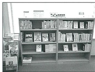
就活・仕事関連図書コーナー(図書館1階)

「就活・仕事関連図書コーナー」には、おもに面接やSPI・一般常識試験の対策、エントリーシートの書き方など、実践に役立つ書籍を置いています。